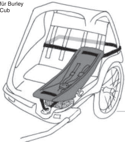
Abb. 2 Gilt nur für Burley Cub